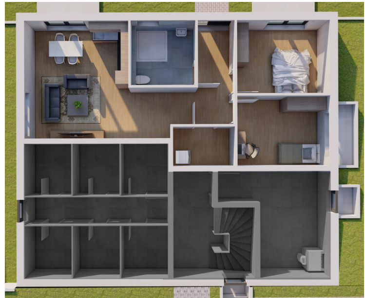
Untergeschoss Wohnung Nummer 1