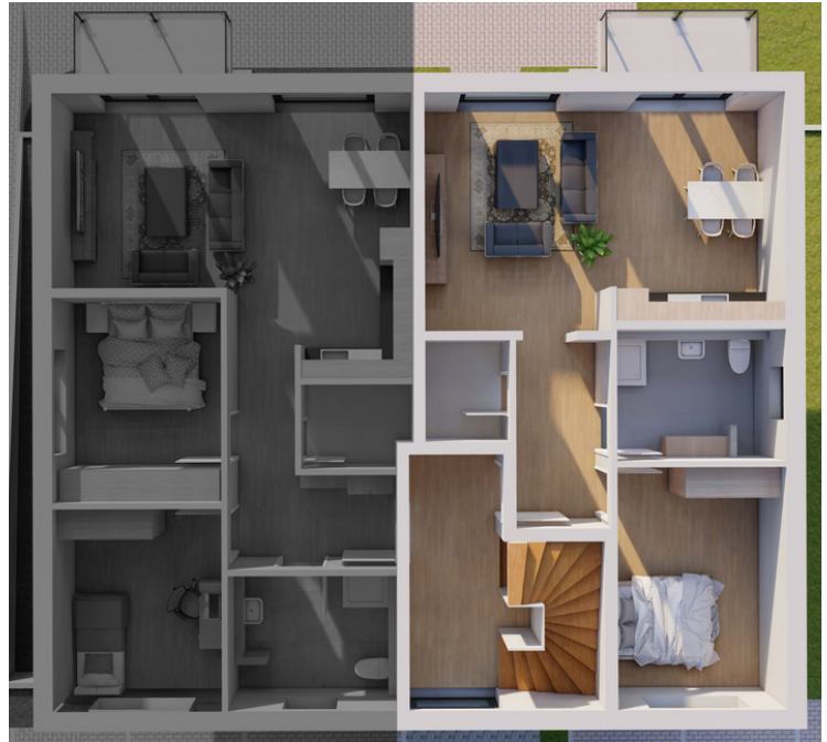
Obergeschoss Wohnung Nummer 5