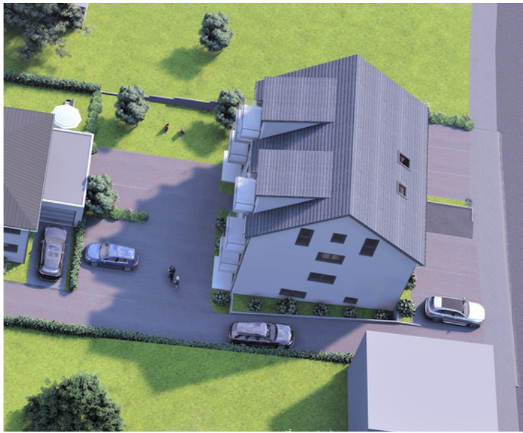
Stellplätze vor und hinter dem Haus