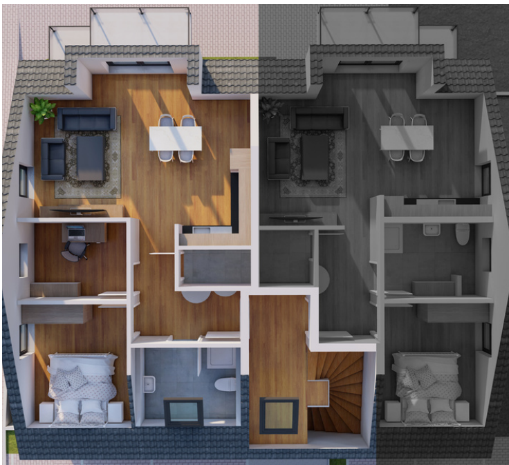
Dachgeschoss Wohnung Nummer 6