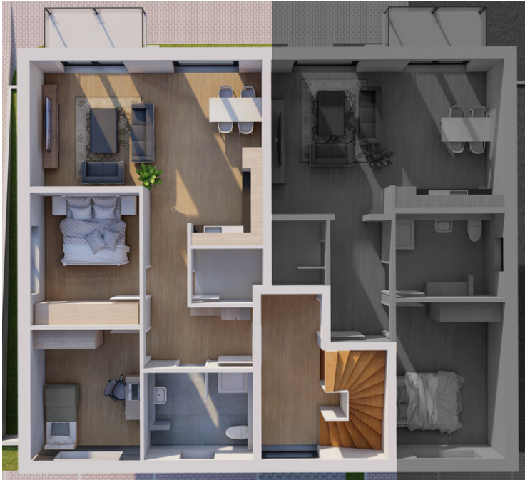
Obergeschoss Wohnung Nummer 4