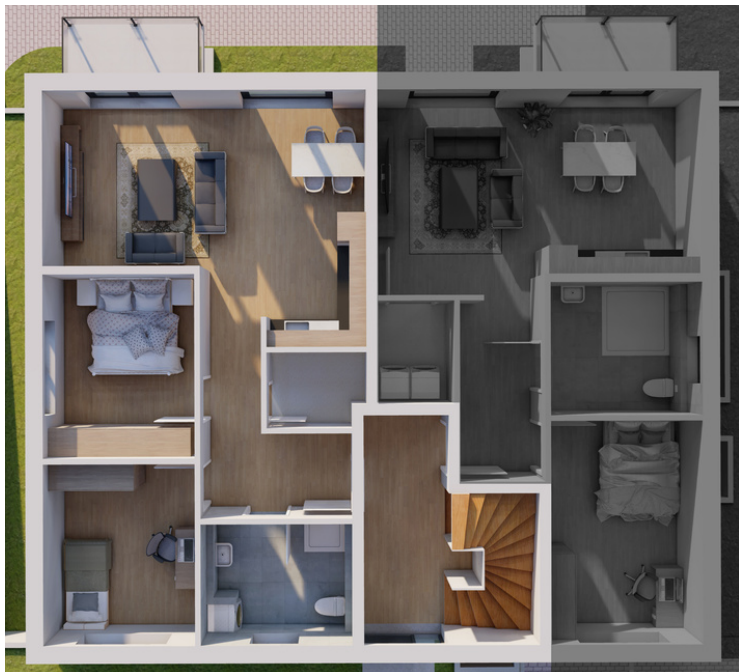
Erdgeschoss Wohnung Nummer 2