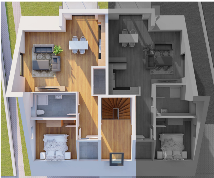
Dachgeschoss Wohnung Nummer 5