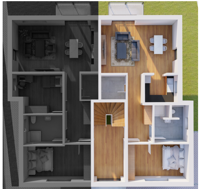
Obergeschoss Wohnung Nummer 4