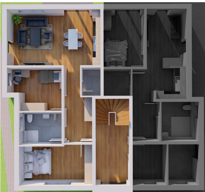
Erdgeschoss Wohnung Nummer 1