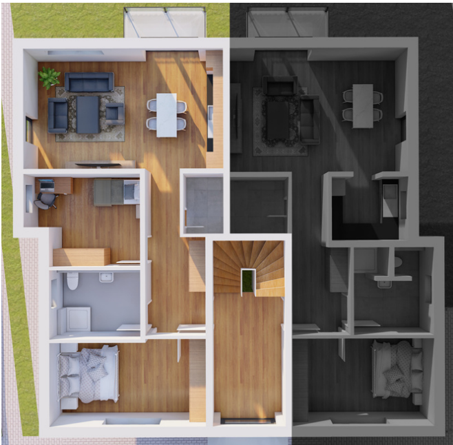
Obergeschoss Wohnung Nummer 3