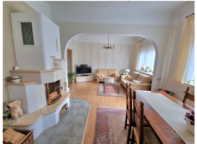
Essbereich / Wohnzimmer mit Kamin